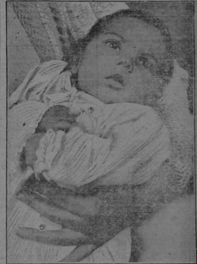
WANT to SAVE the BABIES' LIVES

SAVING BABIES IS WORK OF SOCIETY MEETING IN ANNUAL CONVENTION